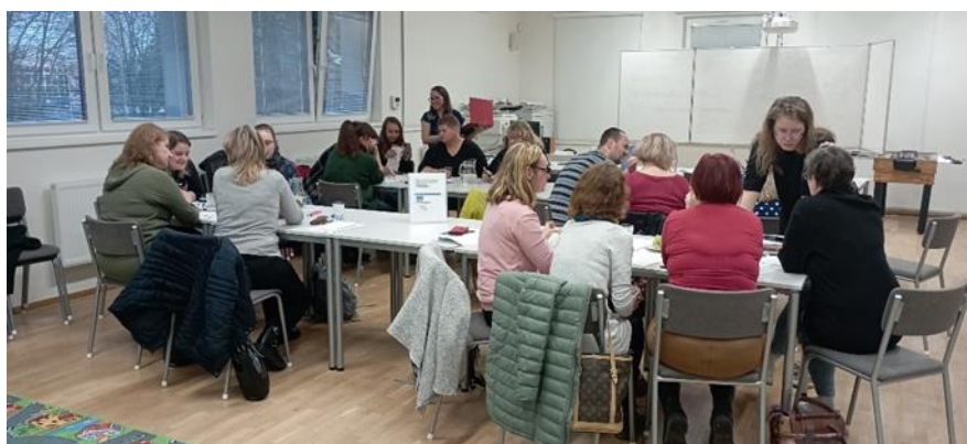
jednání Pracovních skupin