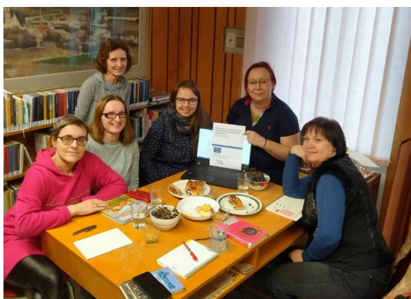
jednání PS pro rozvoj čtenářské gramotnosti a rozvoj potenciál každého žáka