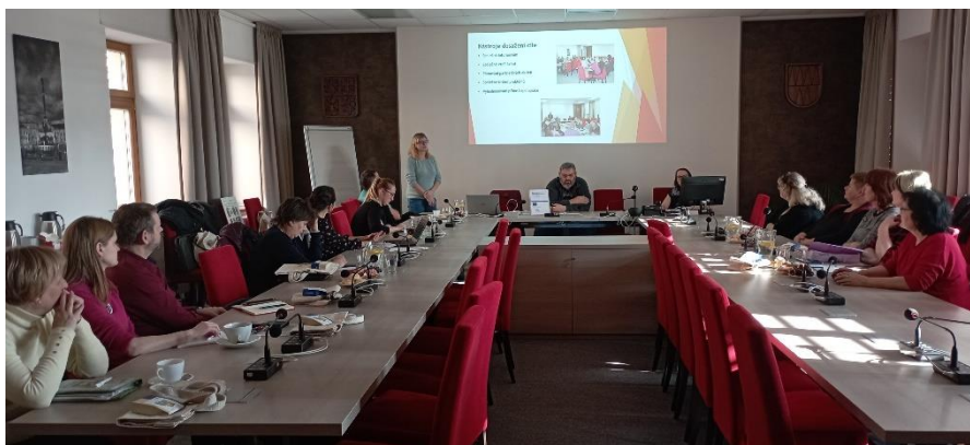
jednání Řídícího výboru